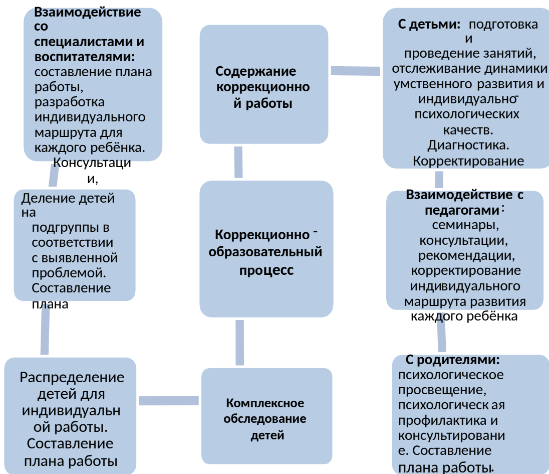
Схема организации работы учителя-логопеда